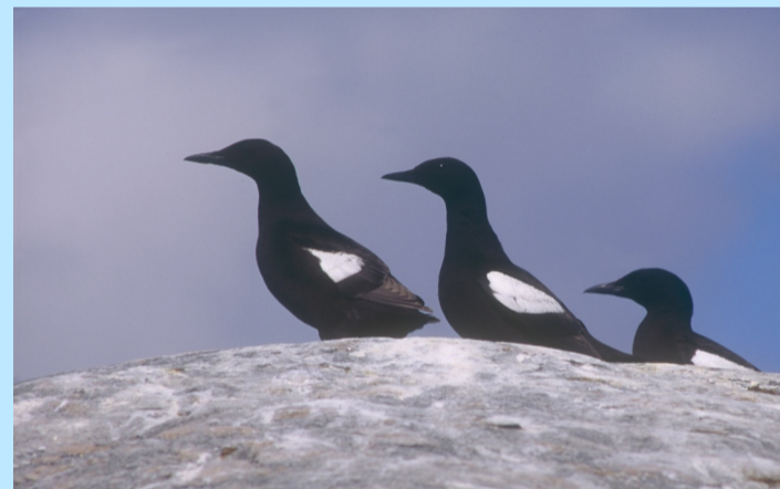
Tobisgrisslan har vid Väderöarna sitt starkaste fäste på hela västkusten.