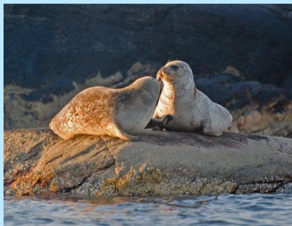
Det finns gott om knubbsäl vid Väderöarna.